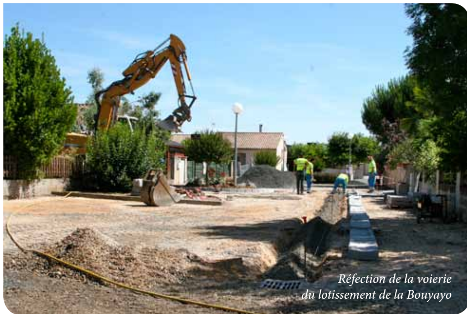
Réfection de la voirie du lotissement de la Bouyayo

A u mois d'avril dernier, le Conseil municipal a procédé au vote du budget 2015. Que retenir de ces délibérations ? Tout d'abord, le fait que les taux d'imposition locale n'ont pas été augmentés. Ce maintien de la part communale des impôts à son niveau de 2014 résulte de la volonté de la municipalité de ne pas alourdir les dépenses des ménages dans le contexte de crise que nous connaissons. Cependant, gestion rigoureuse ne signifie pas arrêt des investissements. Retraccés dans la section d'investissement du budget général qui s'équilibre à 870 243 euros, plusieurs chantiers vont pouvoir être financés (lire encadré ci-contre) et des projets à plus long terme étudiés (lire notre dossier sur l'amé-